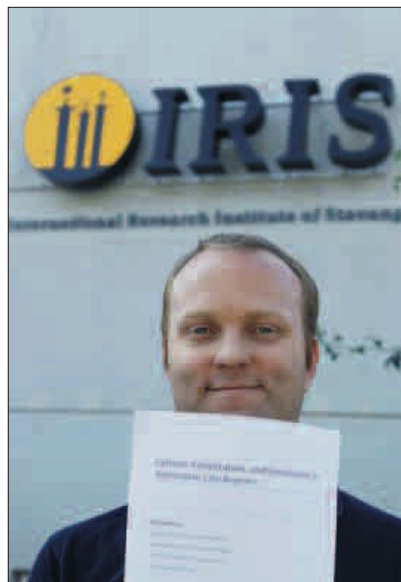
KOM DERE UT: – Bedriftene blir mer innovative av å reise ut i verden og skaffe seg kunnskap og partnere, sier seniorforsker Rune Dahl Fitjar ved International Research Institute of Stavanger.

– Bedriftene blir mer innovative av å reise ut i verden og skaffe seg kunnskap og partnere, enn å satse på regionale samarbeidspartnere. Også jeg tror at